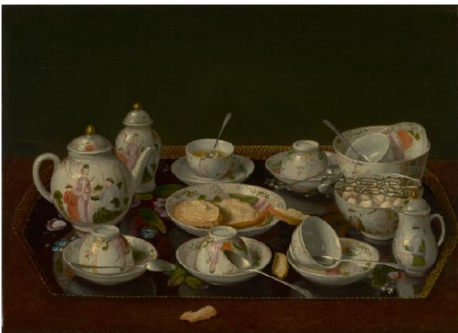
Jean-Étienne Liotard: Tea Set um 1781-1783

In den letzten Wochen, in denen aufgrund der Infektionsgefahr durch das Corona-Virus alle Museen geschlossen waren, haben der Instagram-Account „tussenkunstenquarantaine“ und das Getty-Museum in Los Angeles dazu aufgefordert, berühmte Gemälde nachzustellen und die entsprechenden Fotos hochzuladen. Angeregt durch diese Aktion haben sich die Schülerinnen und Schüler des Grundkurses im Kunstunterricht der Q1 sowie ein EF-Kunstkurs viele Werke bedeutender Künstlerinnen und Künstler in den virtuellen Museumsrundgängen angeschaut. Eines hat jeder ausgewählt, mit zur Verfügung stehenden Materialien nachgestellt und fotografiert.