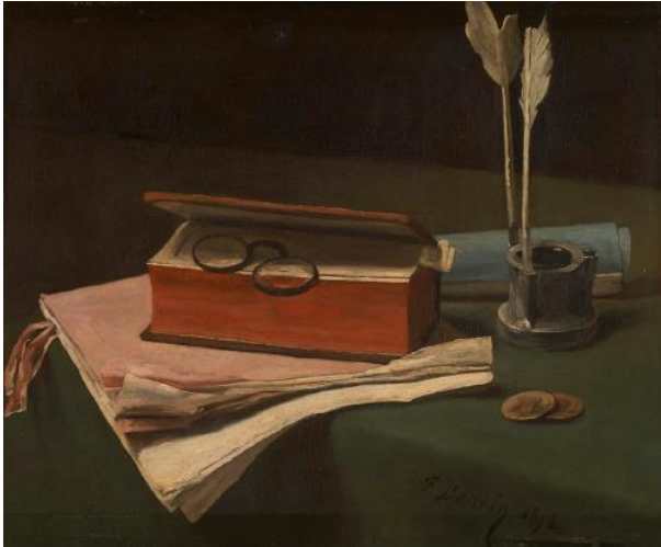
Francois Bonvin, Still life with Book, 1876