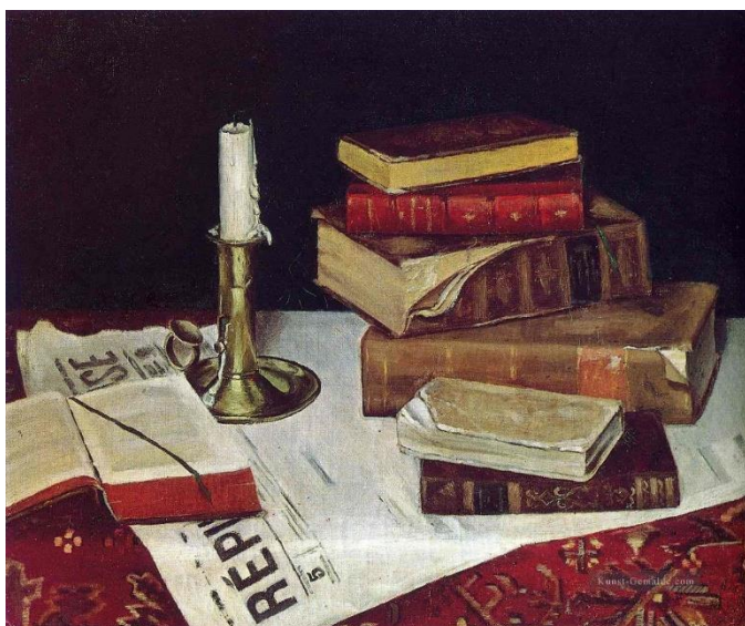
Henri Matisse: Original books and candle 1890